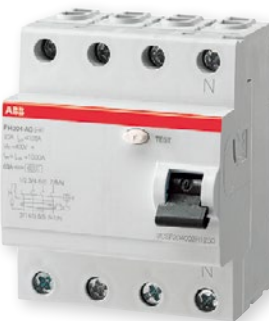
Proudový chránič FH204 AC