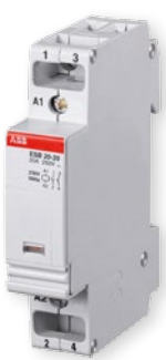
Instalační stykač ESB20