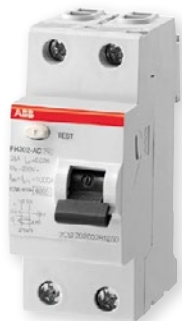
Proudový chránič FH202 AC