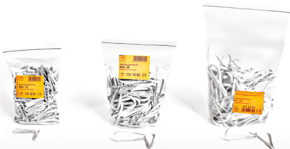
Pásové hmoždinky - BSL